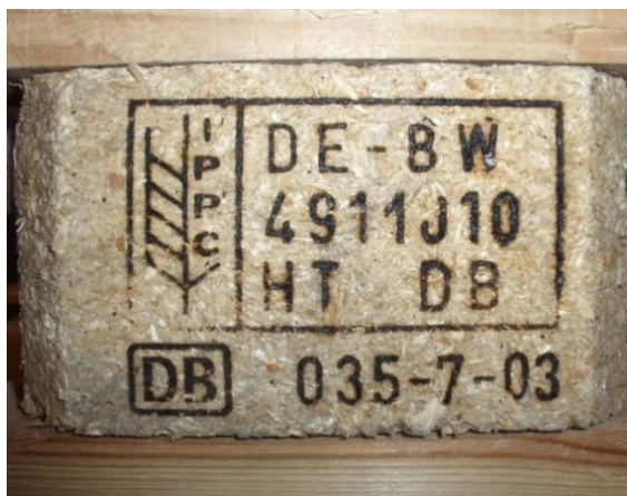
Figur 5 - Behandlet treemballasje er merket etter den samme standarden. Ved siden av IPPC-logoen vises først landkoden, deretter virksomhetsnummeret til produsenten og sist behandlingen, som er enten HT (Heat Treatment), MB (Methyl Bromide Treatment), DH (Dielectric Heating) eller SF (Sulphuryl Fluoride).

Du kan lese mer i Faktaark- Treemballasje som følger med importerte varer (mattilsynet.no)