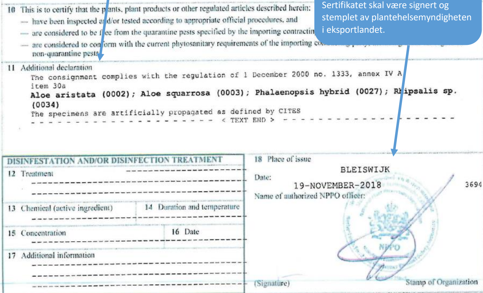
Figur 3 - Eksempel på hvordan et plantesunnhetssertifikat ser ut. Dette er nederste halvdel av sertifikatet.

Sertifikatet skal være signert og stemplet av plantehelsemyndigheten i eksportlandet.