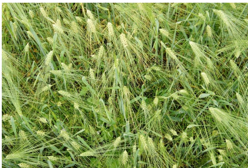
Bilde 6. Bygg.

Det er mer utfordrende å bli selvforsynt med proteinfôr enn karbohydratfôr. Det anses ikke som realistisk å bli selvforsynt med proteinvekster, men det er fullt mulig å øke produksjonen betydelig først og fremst gjennom dyrking av erter og åkerbønner.