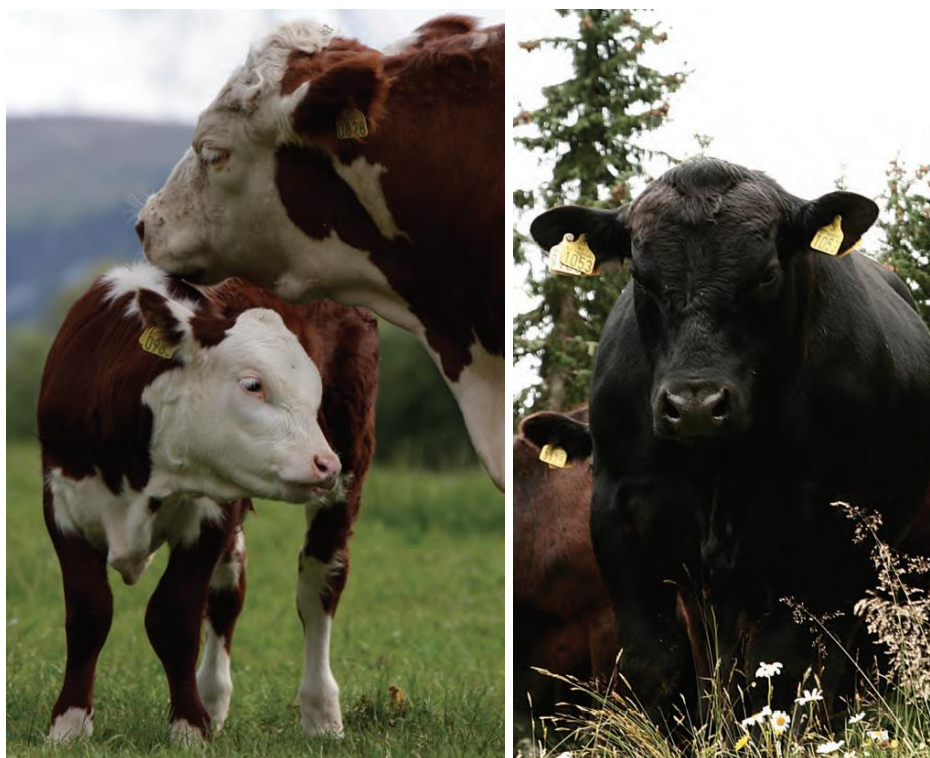
Bilde 5. Lette raser av kjøttfe, Hereford til venstre og Aberdeen Angus til høyre.

Hvis det blir krav om at det også skal være norskproduserte råvarer i det økologiske kraftfôret, vil dette føre til økt etterspørsel etter norsk økologisk dyrket korn.