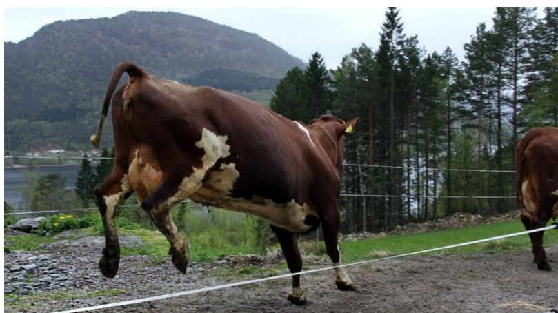
Bilde 3. Kuslepp.

Slik regelverket er i dag, kan kraftfôrfirmaene importere alle råvarene de trenger til de økologiske drøvtyggerblandingerne. Men hvis så mye norskproduserte råvarer som mulig skal brukes og antallet melkekyr øker, blir behovet stort for norsk økologisk fôrkorn til melkeproduksjon fremover.