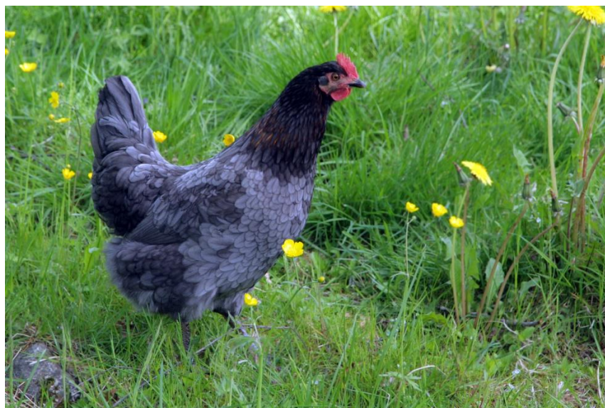
Bilde 1. Høne i eng.

Opplysninger fra produksjonstilskudsregisteret for 2016 viser at nesten halvparten av gårdene som har 7 500 verpehøner også har kornareal nok til å være 20 % selvforsynt med eget økologisk fôr under forutsetning av at de dyrker økologisk havre eller hvete og at avlingsnivået er mellom 260 og 330 kg/daa. Øker kravet til 30 % egetprodusert fôr, trengs det nærmere 400 daa økologisk kornareal for å være selvforsynt med eget fôr, og da er det potensielt 1/3 av gårdene som kan oppfylle kravet.