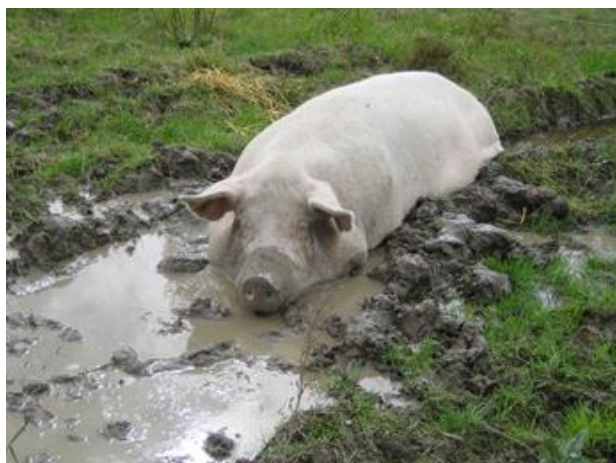
Bilde 2. Gris som koser seg med gjørmebad.

Ved våre beregninger er det ikke tatt hensyn til at deler av eller alt grovfôret kan være produsert på egen gård.