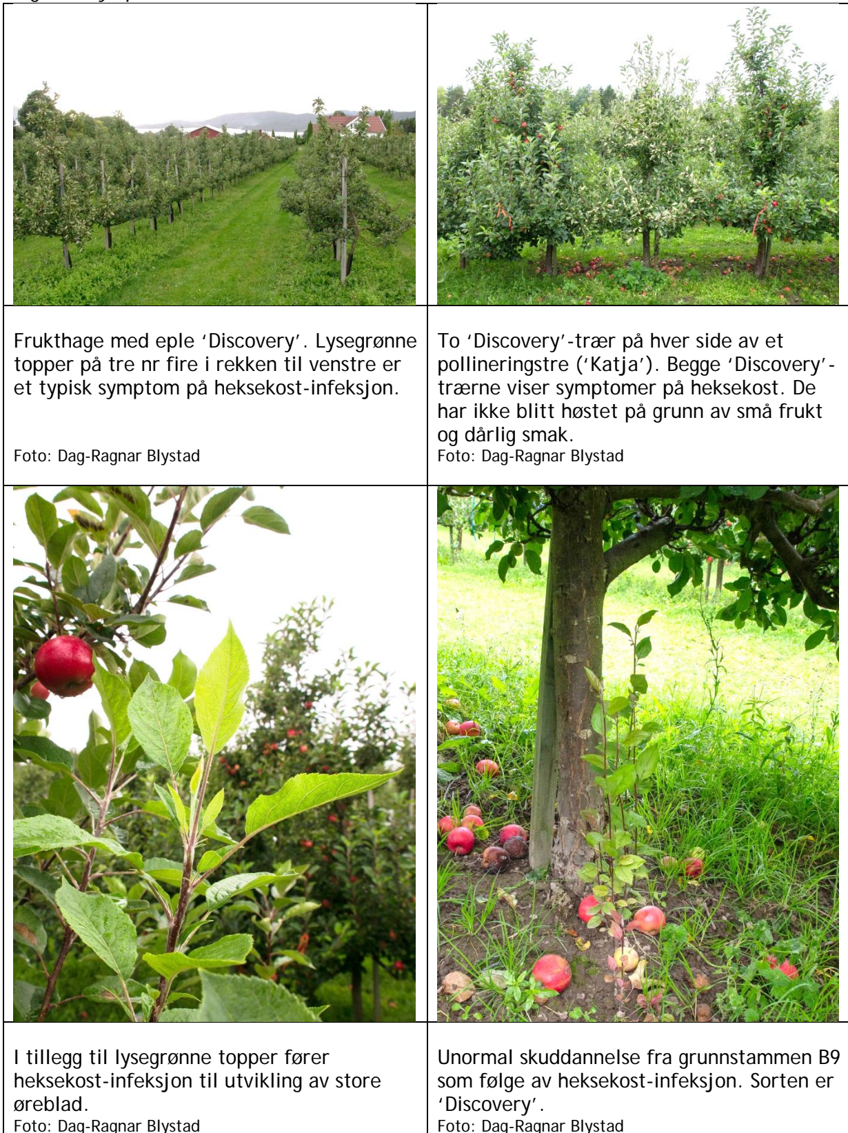
Figur 1. Symptomer forårsaket av heksekost