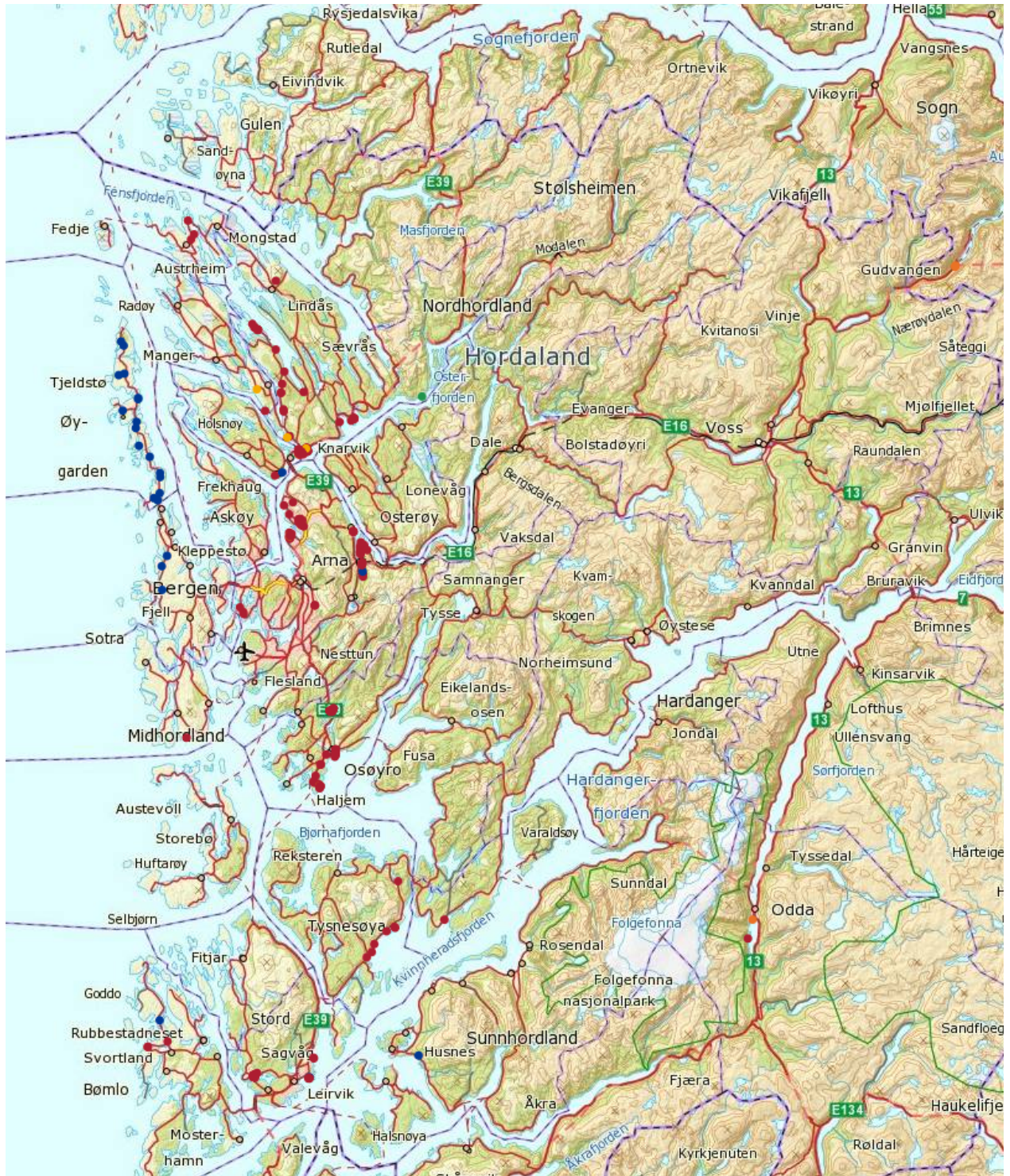
Figur 4. Registreringer med GPS i Hordaland. Blå punkter viser her plassering av bikuber.