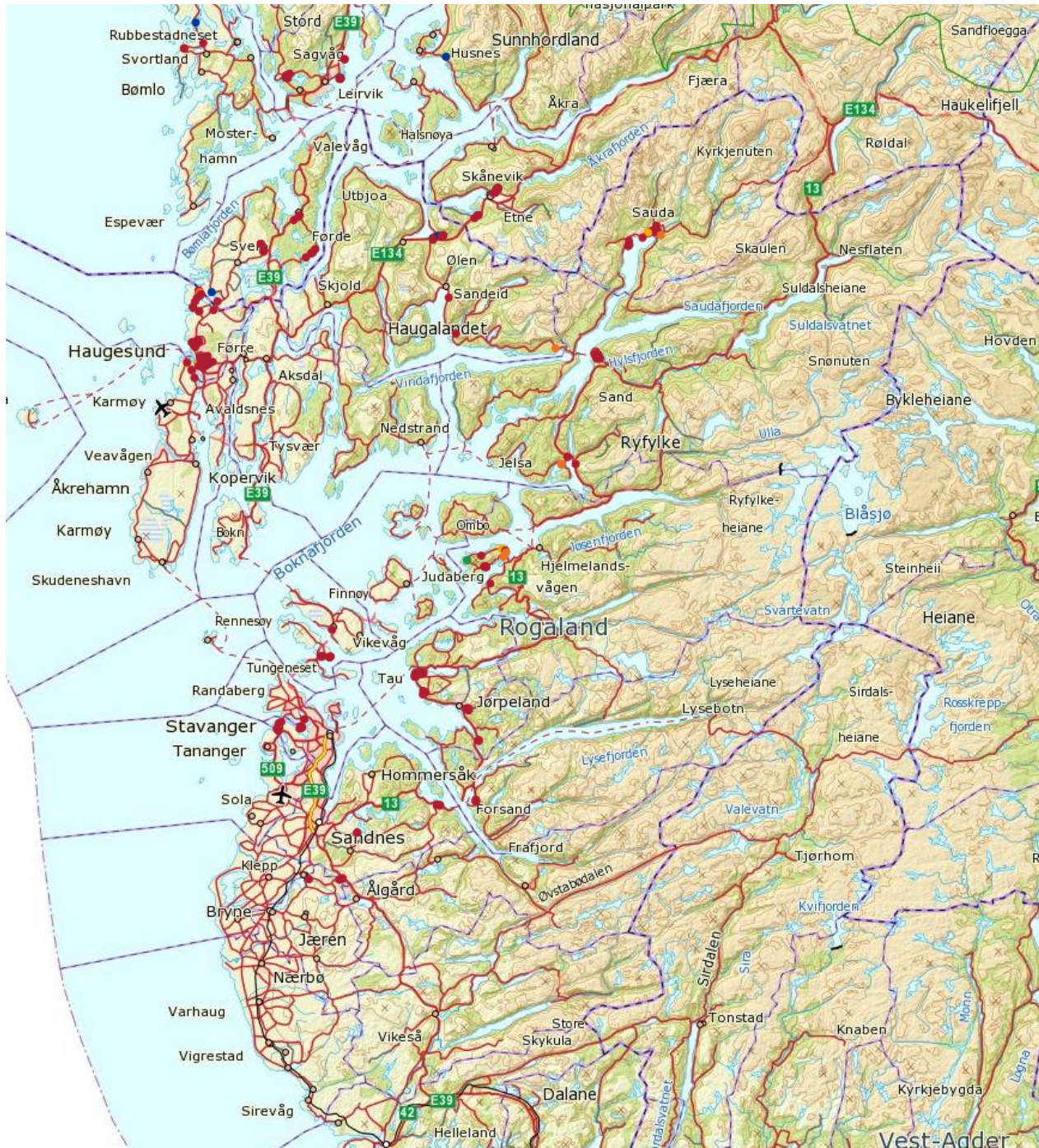
Fig. 5. Registreringer med GPS i Rogaland