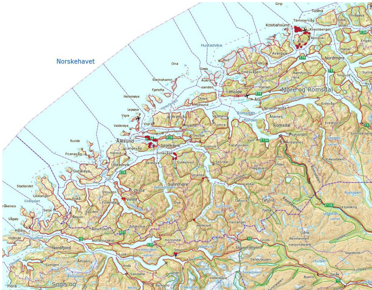
Fig. 3. Registreringer med GPS i Møre og Romsdal