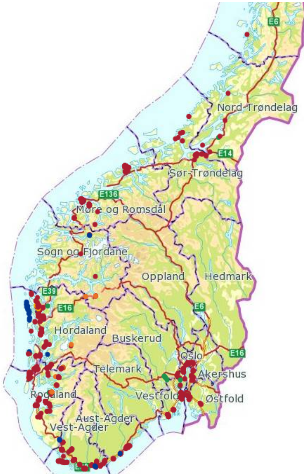
Figur 1. Landsoversikt for registreringer i 2014 med nettbrett og GPS. Detaljerte kart finnes i figur 2-7. Røde punkter: bulkemispel, gule punkter: pilemispel, blå punkter: andre mispler og bikuber, grønne/gule punkter: eple/pære.