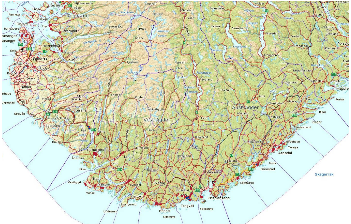
Fig. 6. Registreringer med GPS i Rogaland og Agder